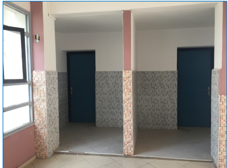
.... junto a ella, están los aseos