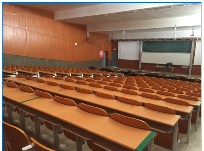
Anfiteatro 1, 2: con capacidad para 200, 250 personas respectivamente, aptos para recepciones y conferencias