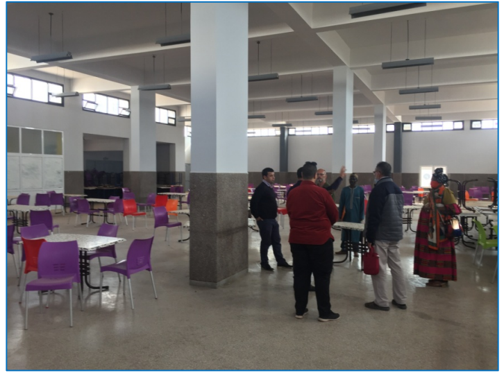
El Refectorio: grande, espacioso y con capacidad para más de 600 personas,