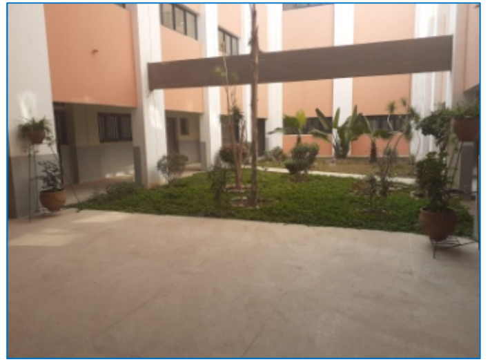
Un espacio verde que también podría utilizarse para un taller