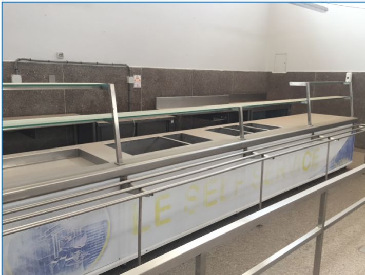
con el mostrador de distribución