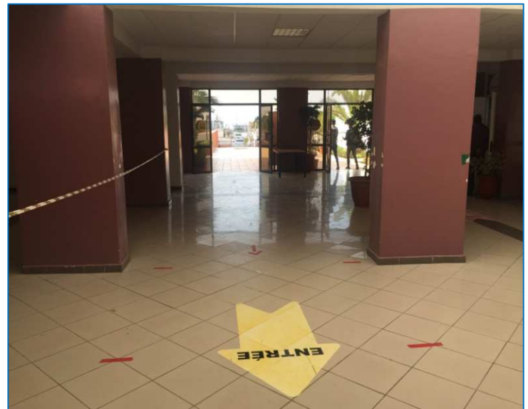
El 1er Salón: un gran espacio situado en la entrada que puede servir de sala de recepción para los Ridéfiens a su llegada