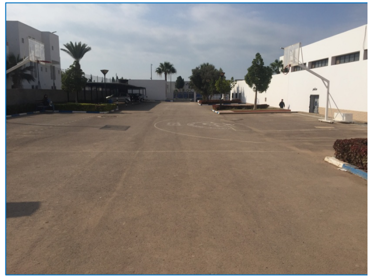
Otros espacios abiertos, pista de baloncesto y aparcamiento