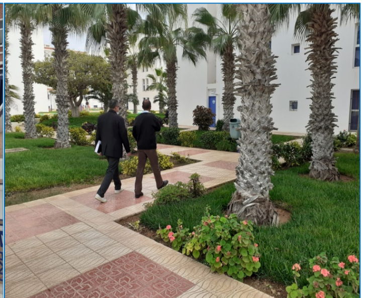
El alojamiento que se utilizará para la estancia de los participantes de la Ridedf. Es un lugar muy bonito con mucha naturaleza y bien mantenido