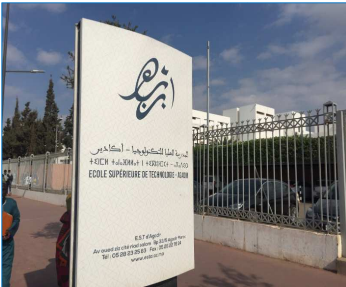
En la entrada principal del edificio de la Escuela Superior de Tecnología (EST)