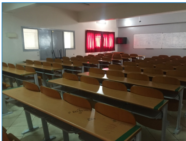
Les salles des langues et cours et la bibliothèque : pouvant accueillir les conférences, les ateliers longs et cours