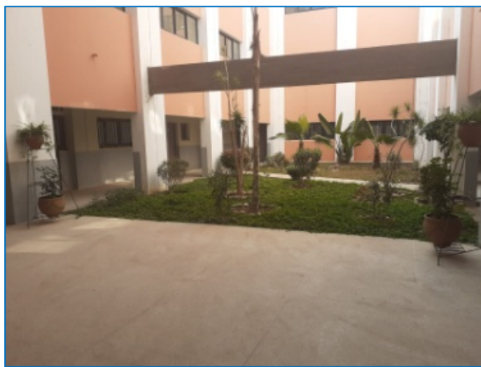
Un espace vert qui pourrait également être utilisé pour un atelier