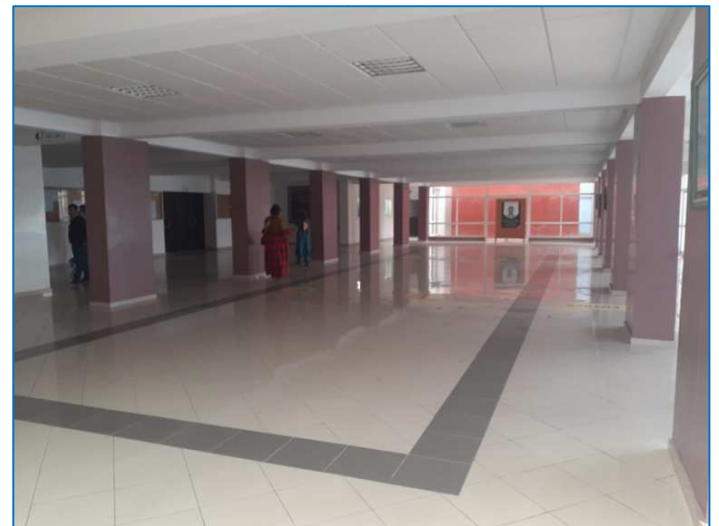
- Le 2 ème Hall : un grand espace pouvant abriter les soirées interculturelles et/ou pour les expositions