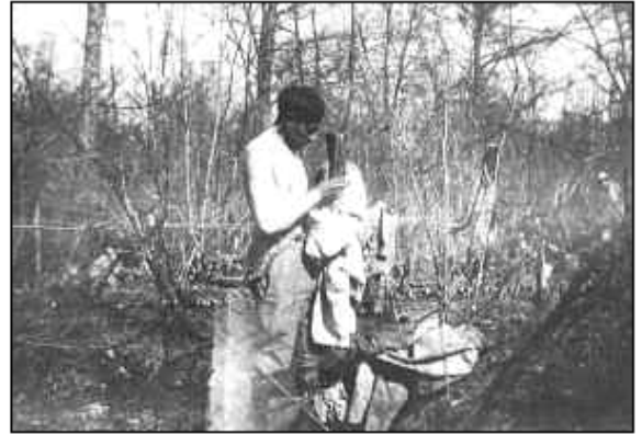
Luizen doden (Oorlogsmuseum)