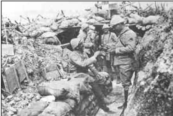
In de loopgraven (Militaire Filmdienst)

Twee keer per dag wordt er voedsel gehaald uit de achterhoede. Maar soms gebeurt het dat een onverwachte granaat de soep omkiepert en de drager ervan doodt.